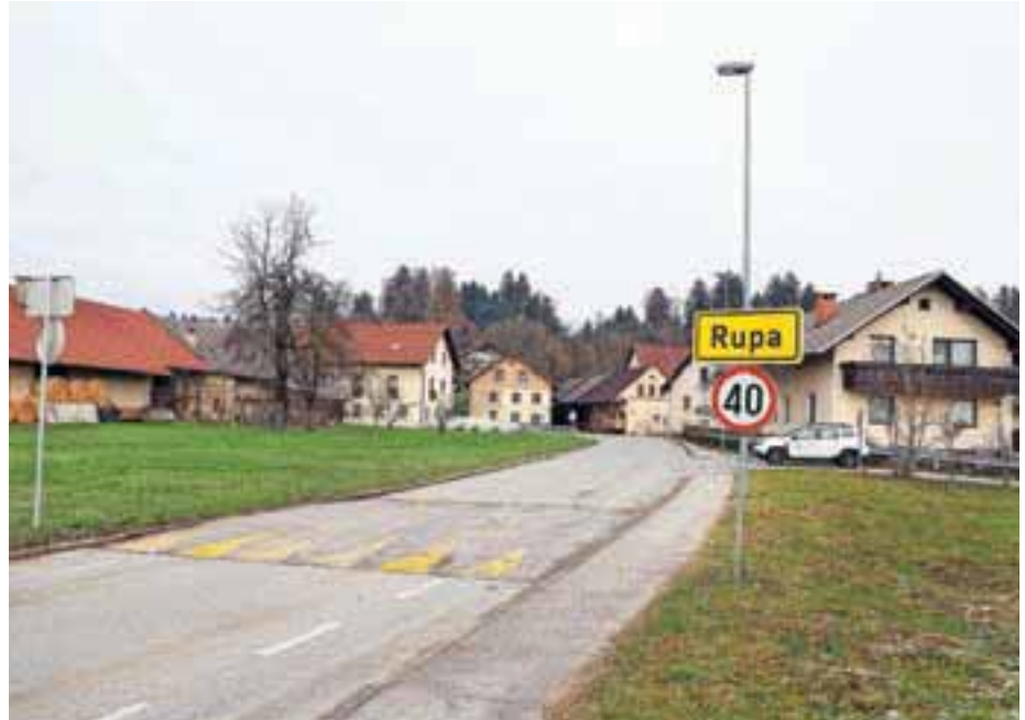
Začetek gradnje komunalnih vodov na Rupi, ki bo sicer potekala v treh fazah, so prestavili v leto 2023.

Kanalizacijo na Rupi bodo gradili v treh fazah. Druga faza bo potekala od križišča ob objektu Rupa 4a do konca ulice (Rupa 14), tretja faza pa na dveh odsekih odsekih od objekta Rupa 30 do objekta Rupa 36b in od objekta Rupa 27 do objekta Rupa 29a.