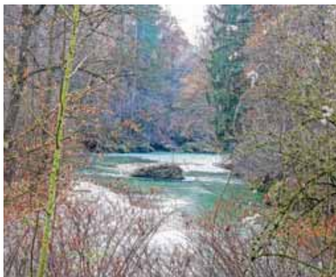
Reka Kokra

2. Upravo RS za zaščito in reševanje na klicno številko za intervencijo oziroma klic v sili na 112, če opazite, da izteka v reko nevarna snov, da je reka onesnažena, ali opazite druge pojave, ki predstavljajo nevarnost za življenje ali zdravje ljudi in živali ali za varnost premoženja, kulturne dediščine in okolja.