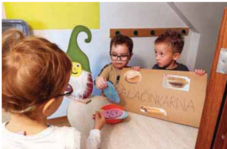
S pomočjo različnih sličic smo namesto prehranske piramide izdelali prehranski semafor.

Jezika so se otroci učili preko dramatizacije pravljice. Igralnico smo spremenili v »gledališko dvorano«. Otroci so za ogled predstave potrebovali vstopnico, ki jo je izdelal vsak sam. Glavni junak