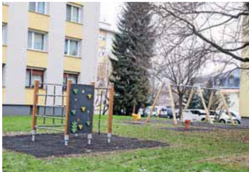
Ob novem otroškem igrišču med blokoma na Valjavčevi ulici 3 in 5 bodo v kratkem postavili tudi dve klopi.

Ureditev parkirišča za e-avtomobile na Valjavčevi ulici še ni prišla v poštev, ker MOK še nima izdelane strategije opremljanja občinskih parkirišč z e-polnilnicami. Zamik in osvetlitev parkirišča Valjavčeva 3–5 ter ureditev nadstreška za klasična in e-kolesa je komisija zavrnila, ker še ni določeno pripadajoče zemljišče. Obnova otroškega igrišča na Mrakovi ulici ni izvedljiva, ker ni v lasti MOK. Sprememba Zoisove ulice (od semaforiziranega križišča pri vrtcu Janina do križišča z Ulico XXXI. divizije) v enosmerno ulico bo mogoča šele po izdelavi študije enosmernih ulic, ki je že v teku. Postavitev vodnega igrala na igrišču Gibi gib pa je bila zavrjnena, ker je v bližini bazen, namenjen za igro z vodo.