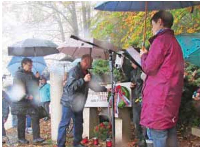
Polaganje vencev na spominski slovesnosti na Jamniku