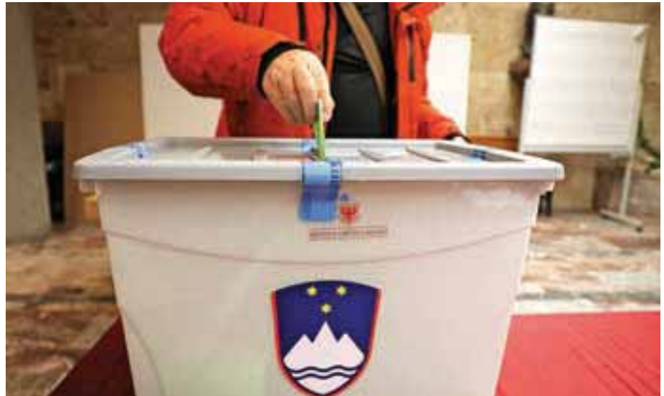
Ker je za sedemčlanski Svet KS Vodovodni stolp novembra kandidiralo le šest kandidatov, bodo januarja izvedli naknadne volitve za sedmega člana.