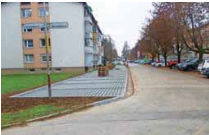
Nova parkirna mesta na Šorlijevi 23

Na Šorlijevi in Zoisovi ulici so jeseni zgradili 19 novih parkirnih mest, od tega deset bočnih, v »zeleni« izvedbi s travnimi ploščami (zatravitev bo spomladi), ki so omejena s cestnimi robniki, vzpostavljena pa je bila tudi prometna signalizacija. Izvedli so tudi odvodnjavanje. Skupna vrednost investicije v devetnajst novih parkirnih mest je bila 41 tisoč evrov.