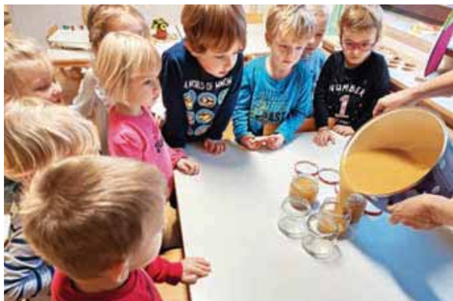
Naredili smo domačo Kekčevo jabolčno marmelado.

v predstavi je sam pripravil jabolčno marmelado iz jabolk, ki jih je nabral v svojem sadovnjaku. Tako smo naredili tudi mi. Najprej smo jabolka narezali in iz njih skuhalo jabolčno marmelado. Kuhanje je bilo zelo zabavno. Raziskovali smo in opazovali, kako se jabolka spreminjajo, mešajo, kaj nastaja. Otroci so se zabavali, strokovni delavki pa sva poskrbeli za varnost pri kuhanju. Veliko smo se pogovarjali, za kaj vse uporabljamo jabolka. Začeli so spraševati, od kod jabolčni sok, ki ga kupimo na trgovskih policah. Skupaj smo raziskovali in ugotovili, kaj se zgodi, če jabolko stisnemo. Nastal je zelo dober jabolčni sok – mošt.